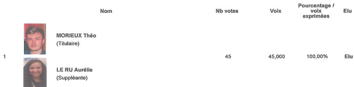
Répartition des votes