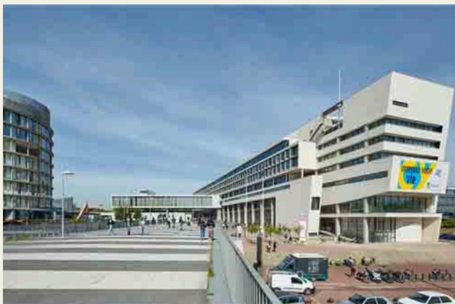
Photo du campus principal de CY, le campus des Chênes; avec notamment le bâtiment abritant le SSE visible à gauche

L'intérêt de ces deux actions est de comprendre comment des initiatives, sur des temporalités d'une journée ou espacées sur dix semaines, peuvent susciter une démarche d'éducation pour la santé. En effet, la journée dédiée au village santé s'étend sur l'ensemble de la journée universitaire, avec un flux continu de stands tenus au coeur du campus des Chênes (cf. Photo).